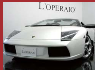
'05 LAMBORGHINI MURCIELAGO ROADSTER パールンボホワイト 7,000km ¥26,750,000