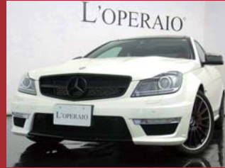
'13 AMG C63 COUPE PERFORMANCE PKG ダイヤモンドホワイト 9,000km ¥9,000,000