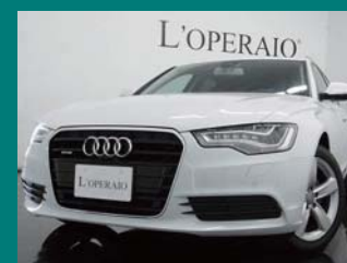
'12 AUDI A6 AVANT 2.8 FSI QUATTRO アイビスホワイト 11,000km ¥4,979,000