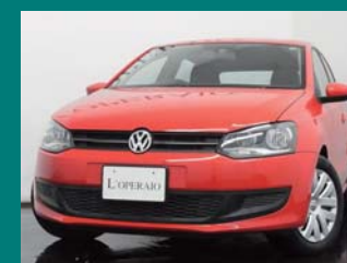
'09 VOLKSWAGEN POLO 1.4 COMFORTLINE フラッシュレッド 18,000km ¥1,299,000