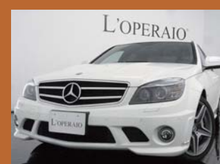
'08 AMG C63 カルサイトホワイト 41,000km ¥4,809,000