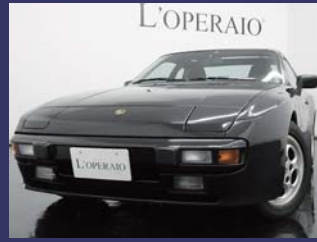
'87 PORSCHE 944 サテンブラックメタリック 45,000km ¥1,309,000