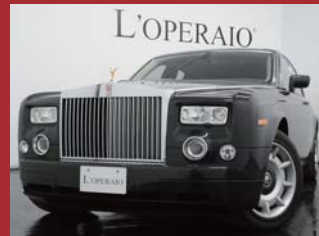
'04 ROLLS-ROYCE CENTENARY PHANTOM ダークカーボン 15,000km ¥22,000,000