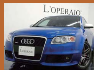
'08 AUDI RS4 AVANT 4.2 スプリントブルー 19,000km ¥6,159,000