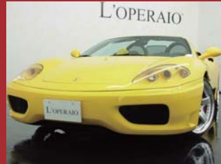
'03 FERRARI 360 SPIDER F1 ジアットモテナ 28,000km ¥8,800,000