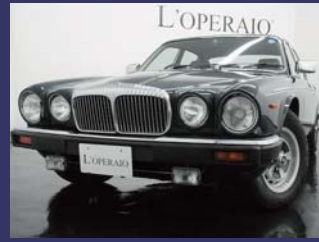
'91 DAIMLER DOUBLE SIX ページュ革 1オーナー 取説 禁煙車 グリーン 7,000km ¥4,509,000