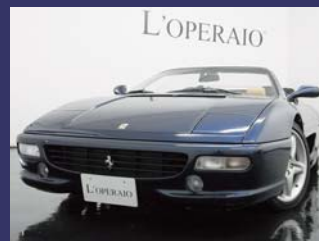
'99 FERRARI F355 SPIDER F1 正規CORNES最終モデル 記録簿15枚有 可変マフラー ブルーツールドフランス 36,000km ¥8,000,000