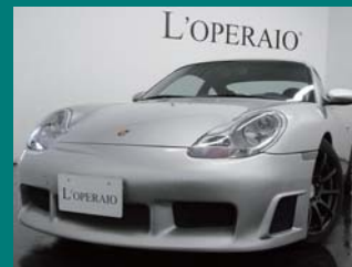
'99 PORSCHE 996 CARRERA アーキティックシルバー 41,000km ¥2,499,000