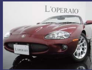
'00 JAGUAR XKR CONVERTIBLE カーニバルレッド 42,000km ¥2,909,000