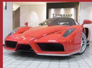
'04 FERRARI ENZO 正規CORNESディーラー車 1オーナー スペシャルオーダーカラー ロッソコルサ 7,000km ¥130,000,000