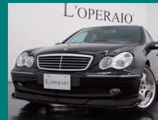
'02 MERCEDES BENZ KLEEMANN C325 オプシディアンブラック 33,000km ¥2,999,000