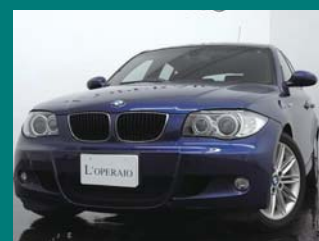
'06 BMW 118i M-SPORT ルマンブルー 50,000km ¥1,149,000