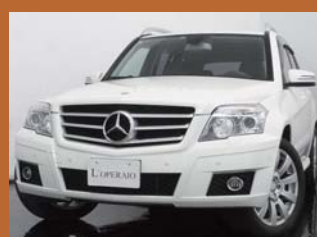
'11 MERCEDES BENZ GLK300 カルサイトホワイト 36,000km ¥3,979,000