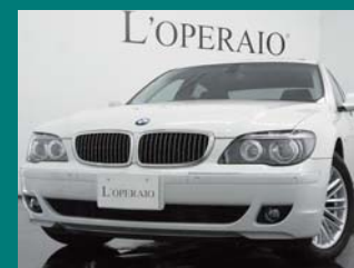
'06 BMW 750Li アルビノホワイト 33,000km ¥2,759,000