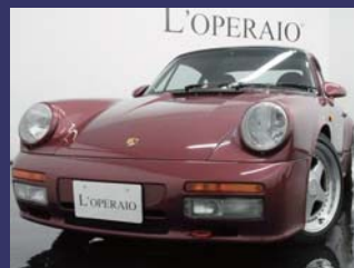
'90 PORSCHE 911 (TYPE930) CARRERA RS 3.4C SMT ベルベットレッド 7,000km ¥11,500,000