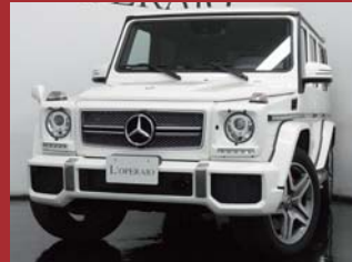
'13 AMG G65 LONG V12 BITURBO 新車保証メルセデスケア保証継承 デジーノミスティックホワイトII 15,000km ¥23,800,000