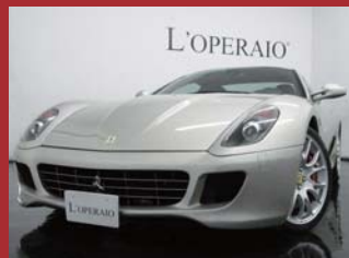
'07 FERRARI F599 F1 グリジオ・イングリッド 21,000km ¥16,850,000