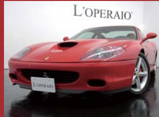
'02 FERRARI 575M MARANELLO ロッソコルサ 10,000km ¥7,709,000