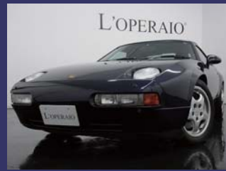
'91 PORSCHE 928 GTS ミッドナイトブルー 39,000km ¥2,809,000