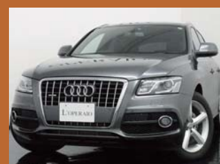
'11 AUDI Q5 2.0 FSI QUATTRO ラバーグレー 16,000km ¥4,579,000