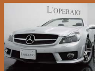
'08 AMG SL63 イリジウムシルバー 42,000km ¥8,180,000