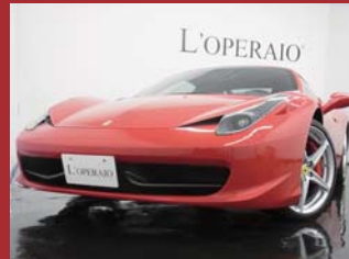
'11 FERRARI 458 ITALIA F1 DCT ロッソコルサ 15,000km ¥24,500,000