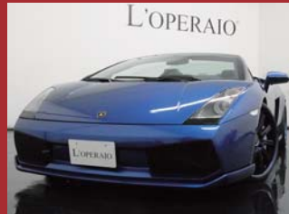
'07 LAMBORGHINI GALLARDO SPYDER E-GEAR ブルーカーラム 35,000km ¥15,000,000