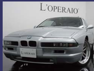
'95 BMW 840i M-INDIVIDUAL アークティックシルバー 54,000km ¥2,509,000