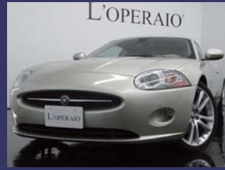
'06 JAGUAR XKR COUPE 4.2 ラグジュアリー 希少左ハンドル ページュレザ ウィンターゴールドメタリック 39,000km ¥3,909,000