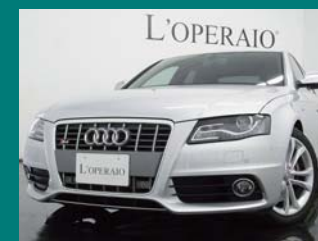
'09 AUDI S4 3.0 QUATTRO アイスシルバー 54,000km ¥3,759,000