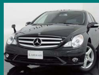
'07 MERCEDES BENZ R500 4-MATIC AMGスポーツPKG オプシディアンブラック 14,000km ¥3,749,000