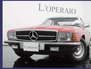
'85 MERCEDES BENZ 500SL R107 中期モデル シグナルレッド 11,000km ¥2,809,000