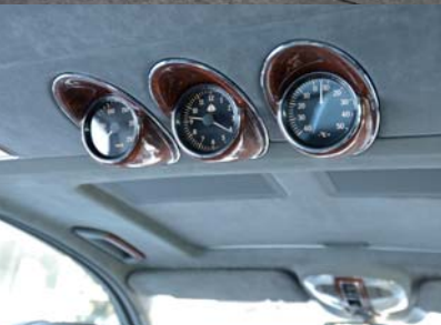
'05 MAYBACH 57 ナヤリットシルバー/ヒマラヤグレー 9,000km 世田谷ショールーム