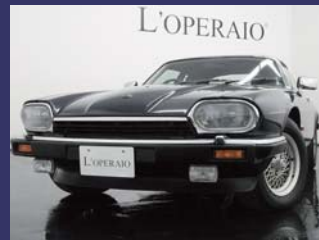
'93 JAGUAR XJ-S V12 COUPE ウェストミンスターブルー 41,000km ¥3,209,000