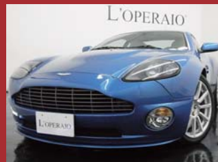
'06 ASTON MARTIN V12 VANQUISH 正規ディーラー車 外装オーダーカラー ヴォーティゴブルー 27,000km ¥11,500,000