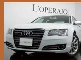
'12 AUDI A8L 4.0 TFSI QUATTRO DESIGN SELECTION アイビスホワイト 3,000km ¥10,300,000