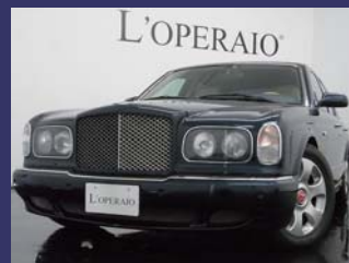
'00 BENTLEY ARNAGE ロイヤルブルーメタリック 42,000km ¥3,859,000