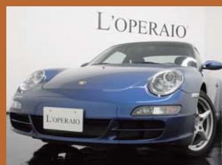
'07 PORSCHE 997 CARRERA TIP-S コバルトブルー 17,000km ¥6,309,000