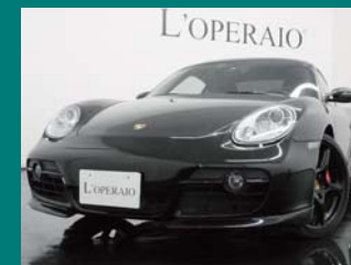
'06 PORSCHE CAYMAN S 3.4 6MT ブラック 48,000km ¥4,159,000