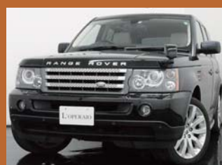
'07 RANGE ROVER SPORTS SUPER CHARGED ジャパブラック 29,000km ¥4,759,000