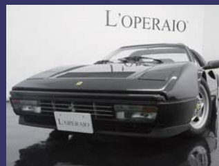
'88 FERRARI 328 GTS 正規ディーラー車 ページュレザー 美走行 ネロメタリック 75,000km ¥5,709,000