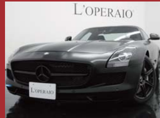
'11 AMG SLS COUPE カーボンインテリア マットブラックラッピング 5,000km ¥18,000,000