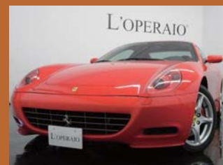
'06 FERRARI 612 SCAGLIETTI F1 ロッソスクーデリア 8,000km ¥14,000,000