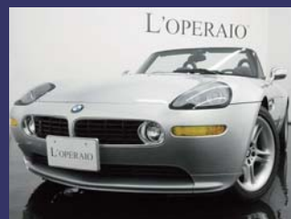
'03 BMW Z8 チタンシルバー 29,000km ¥11,000,000