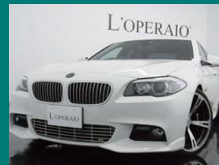
'11 BMW 535i TWIN-TURBO アルビノホワイト 12,000km ¥6,659,000