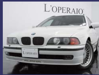
'97 ALPINA B10 TOURING V8 アルピンホワイト 52,000km ¥2,799,000