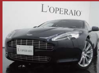
'11 ASTON MARTIN RAPIDE TOUCHTRONIC2 マリアーナブルー 13,000km ¥18,500,000