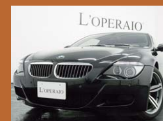
'07 BMW M6 COUPE ブラックサファイア 19,000km ¥3,999,000