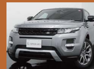
'13 RANGE ROVER EVOQUE COUPE オークニージュ 5,000km ¥6,759,000