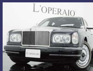
'02 ROLLS-ROYCE SILVER SERAPH ブラックサファイア 1,000km ¥9,500,000