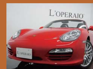
'09 PORSCHE 987 BOXSTER 2.9 ガースレッド 16,000km ¥4,299,000