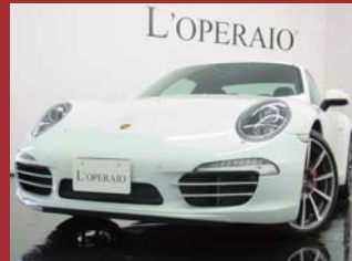
'10 PORSCHE CARRERA S PDK ホワイト 5,000km ¥15,000,000