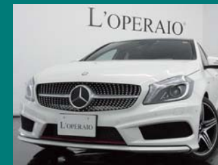
'13 MERCEDES BENZ A250 ポーラホワイト 2,000km ¥4,709,000