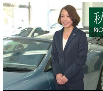
世田谷本社営業部 カープレジャーアシスタント

私は旅行が大好きで、自分の知らなかった世界がどんどん広がっていく感じがとても好きです。ただしあまり頻繁には行けませんので、普段は散歩や映画を観たりして休日を過ごしています。