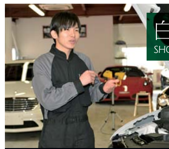
業務本部 テクニカルセンター部

ドライブが大好きなので、休日には家から遠くの温泉を選んで出かけています。道のりが長ければ長いほどドライブが楽しめるので、温泉と車が趣味の自分にとっては一石二鳥です(笑)。