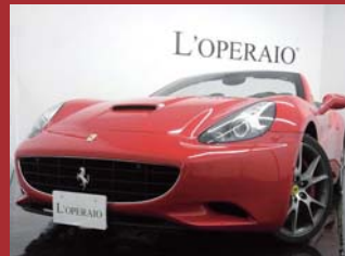
'09 FERRARI CALIFORNIA DCT ロッソコルサ 9,000km ¥19,000,000