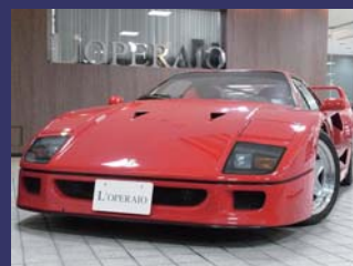
'90 FERRARI F40 コーンズ正規モデル ロッソコルサ 15,000km ¥65,500,000