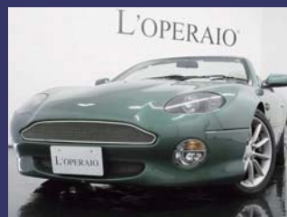
'01 ASTON MARTIN DB7 V12 VANTAGE VOLANTE アストンマーチンレーシンググリーン 29,000km ¥6,199,000