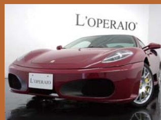
'09 FERRARI F430 F1 ロッソムジエロ 5,000km ¥17,500,000