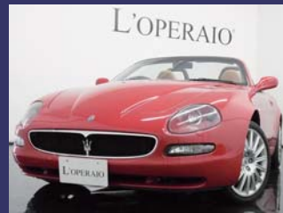
'04 MASERATI SPYDER 4.2 CAMBIOCORSA 正規CORNESディーラー車 ロッソモンディアレ 19,000km ¥3,359,000