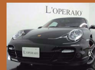
'08 PORSCHE 997 TURBO TIP-S バサルブラック 33,000km ¥9,850,000