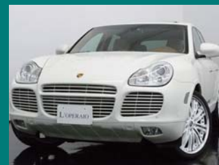
'03 PORSCHE CAYENNE TURBO TIP-S サンドホワイト 59,000km ¥3,159,000