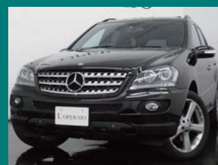
'08 MERCEDES BENZ ML350 4MATIC EDIO オプシディアンブラック 22,000km ¥3,879,000