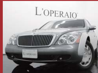
'05 MAYBACH S7 ナヤリットシルバー/ヒマラヤグレー 9,000km ¥19,000,000