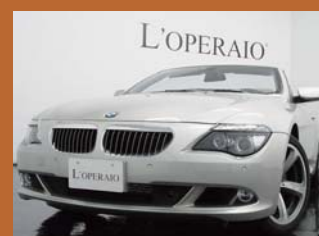
'09 BMW 650i CABRIOLET 後期モデル エクスクルーシブレザー 19インチAW ミネラルシルバー 6,000km ¥4,999,000