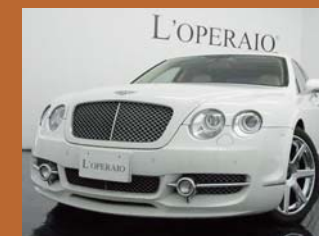
'06 BENTLEY CONTINENTAL FLYING SPUR MANSORY VERSION グレースィヤーホワイト 44,000km ¥9,800,000