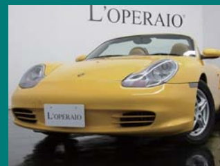
'03 PORSCHE 986 BOXSTER 2.7 スピードイエロー 41,000km ¥2,159,000