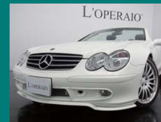
'05 MERCEDES BENZ SL500 アラバスターホワイト 39,000km ¥2,959,000