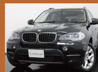
'12 BMW X5 xDRIVE 35D BLUE-PERFORMANCE SELECT PKG ブラックサファイア 19,000km ¥6,309,000