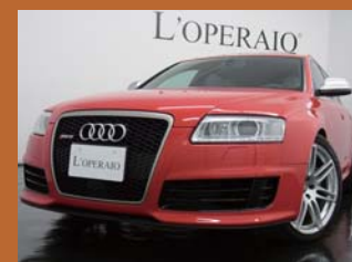
'08 AUDI RS6 AVANT V10 BITURBO ミサレットパールエフェクト 49,000km ¥6,999,000