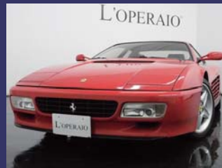
'92 FERRARI 512 TR ロッソコルサ 13,000km ¥11,000,000