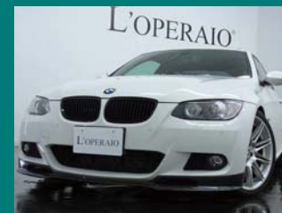
'07 BMW 335i COUPE M-SPORT アルビノホワイト 38,000km ¥3,359,000