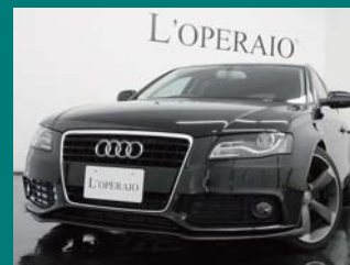
'10 AUDI A4 AVANT 1.8 TFSI ファントムブラック 55,000km ¥2,699,000