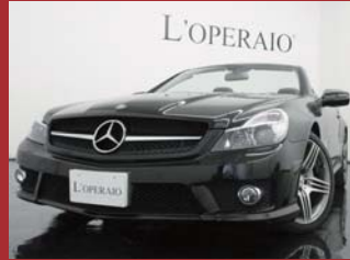
'08 AMG SL63 オプションブラック 30,000km ¥9,150,000