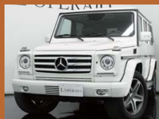
'06 AMG G55L アラバスターホワイト 39,000km ¥7,559,000