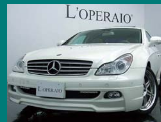
'08 MERCEDES BENZ CLS550 WALD ミスティックホワイト 13,000km ¥4,489,000