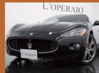
'08 MASERATI GRANTURISMO S ネロ 17,000km ¥12,500,000