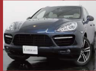
'11 PORSCHE CAYENNE TURBO ダークブルーメタリック 37,000km ¥9,950,000