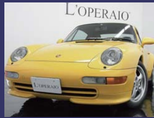
'96 PORSCHE 911 (TYPE993) TIP-S 後期/パノラム ブラックレザ スピードイエロー 49,000km ¥4,559,000