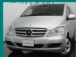
'11 MERCEDES BENZ V350 TREND ラグジュアリーS/バイキセノンPKG イリジウムシルバー 27,000km ¥3,649,000