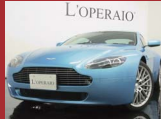
'09 ASTON MARTIN V8 VANTAGE SPORTSHIFT グレイシャルブルー 13,000km ¥10,850,000