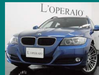
'09 BMW 320i TOURING モンディゴブルー 45,000km ¥1,949,000