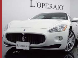
'08 MASERATI GRANTURISMO 4.2 ピアンコエルドラド 35,000km ¥8,600,000